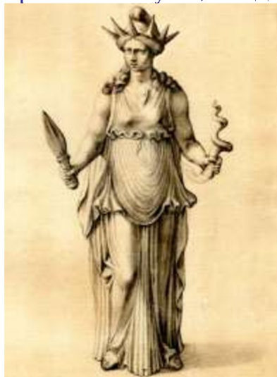
Эрешкигаль Геката, Палаццо деи Консерватори, Рим, копия в Британском музее https://godsbay.ru/orient/ereshkigal.html

Развивающаяся доэллиническая цивилизация охотно переняла эти верования, слегка видоизменив их. В частности, шумерская богиня получила новое имя –