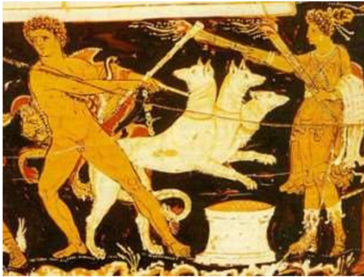
Геката с Цербером. Апульская ваза

Ее называли Геката Тривия , Геката Тройная , ее трехголовые статуи стояли на перекрестках, на которых в полнолуние ее поклонники просили у нее белой магии, а в период Черной Луны – черной.