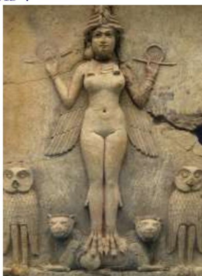
Эрешкигаль, 1800-1750 годы до нашей эры, Британский музей, Лондон

Эрешкигаль ("царица темной земли"), в мифологии народов Месопотамии богиня Куры, хозяйка царства мервых, владычица подземного мира и старшая сестра Инанны (или Иштар в ассирийских и вавилонских текстах). В шумерских мифах Эрешкигаль была единственной, кто мог судить и править в своем царстве. В античные времена древние греки и римляне сопоставляли Эрешкигаль с богиней Гекатой. В заголовке одного из заклинаний так называемого «Магического папируса» из библиотеки Мичиганского университета, который датируется концом третьего века нашей эры, Геката упоминается как «Геката Эрешкигаль».