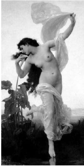
Земля как непрерывное разнообразие жизни