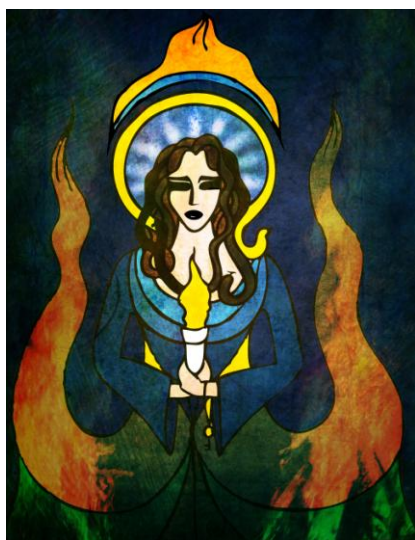
Геката. Художник Soror Laetitia