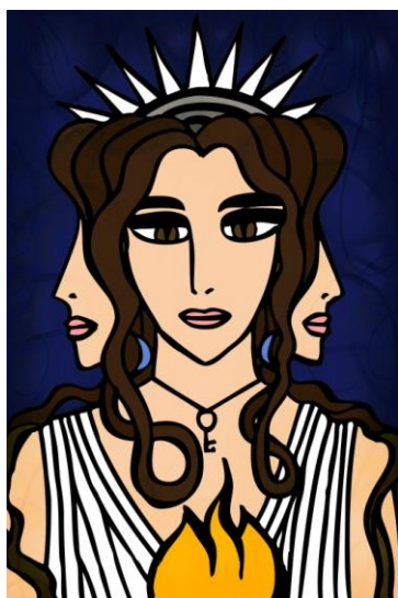
Геката. Художник Soror Laetitia

Это практически второе значимое лицо после демиурга. Отметим, что младшие божества, которых мы визуализируем вокруг себя в одной из частей Звездного Рубина - «иунги», «синохи», «телетархи», даймоны - родом из этого же текста, но они ниже Гекаты по «статусу».