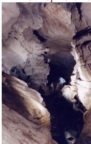
Вид из пещеры на один из входов

Каждый день в темноте он приходит во внутренние залы пещеры и там проводит свои дни, изредка бегая в ближайшие деревни, где его подкармливают. На экскурсантов он не обращает никакого внимания, они его не интересуют, до тех пор пока не нарушают покой пещеры.