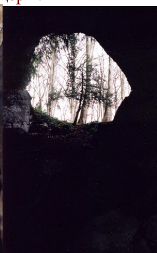
Еще один вход