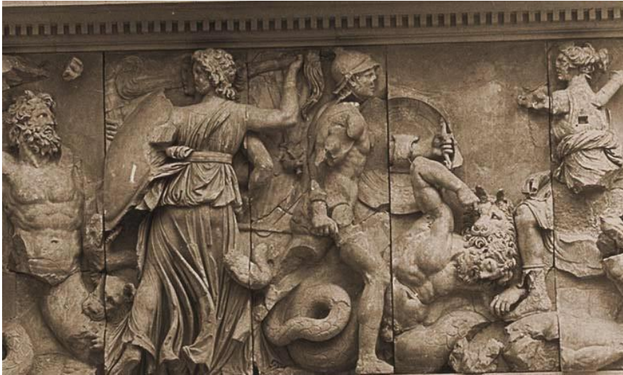
Артемиды и Гекаты в борьбе с Гигантами.

Часть фриза алтаря Зевса в Пергаме. Около 180 г. до н. э. Мрамор