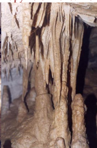
Очень красивые сталактиты