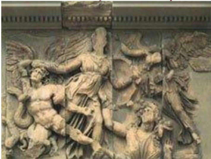
Алтарь Зевса в Пергаме (Геката на войне)

Снаружи ограду алтаря опоясывал грандиозный фриз с изображением мифологической битвы олимпийских богов с их соперниками миггантами за верховную власть. Сплошное поле фриза с могучими рельефными фигурами, тела которых бугрятся мощными формами, обходило все стены ограды и поднималось вдоль ступеней, по которым шли участники ритуала.