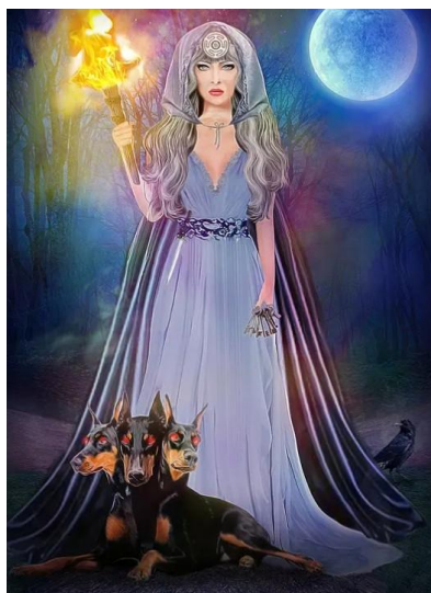
Ода Гекате. По версии А. Кроули

Из Орфея, Книга III. (в переводе А.Кроули)