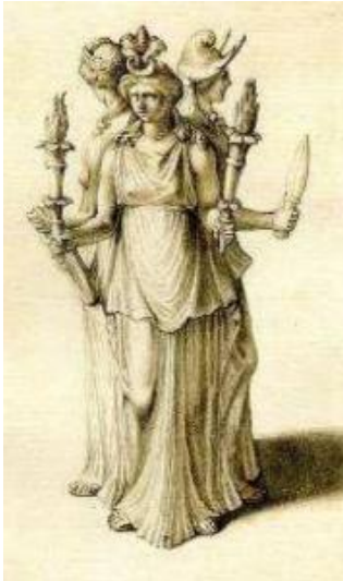
Геката в ее тройной форме

На некоторых изображениях Геката изображена в виде трех лиц. Факты и трицефальные имена Гекаты, чьи статуи были поставлены на перекрестке дорог, связаны с этим тройным изображением. В руках она держит факелы, ключ, нож, а иногда и змею.