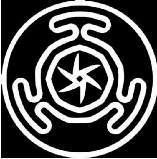
Колесо Гекаты. Стилизованно

Строфалос помогает во многих сферах. Греки использовали его для обретения любви, гаданиях, а также в случаях, когда необходимо воззвать к божеству. Колесо Гекаты неразрывно связано с ней и фактически образует единое целое с богиней. Строфалосу приписывают силу жизни, силу земли, т.е. силы, которыми обладает Геката как фактически одна из богинь-матерей.