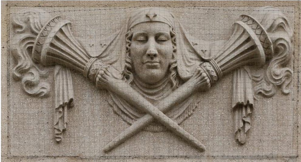
Рельеф с ликом Гекаты и факелами. Здание на ул. Оберангера, 7 в Мюнхене, Германия.

Так как в Древней Греции уже существовали светлые богини, Геката в итоге превратилась в хтоническую богиню, связанную с подземным миром. Причём, что интересно, у других подземных темных божеств или покровителей умерших не было никаких атрибутов, связанных со светом.