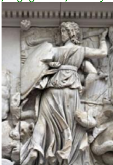
Геката сражается против титанов, алтарь Зевса, Пергам, Турция.

Гекату также иногда связывали с коровой, змеёй, кабаном, львом https://bogi-grecii.ru/simvoly-i-atributy-gekaty/