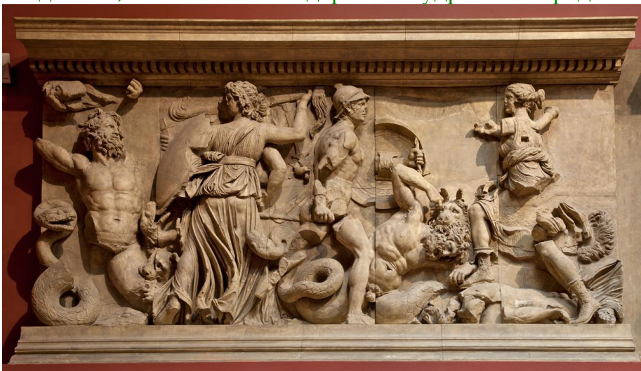
Бой Гекаты с гигантом Клитием. Государственный музей в Берлине, Германия.

Факел представлял собой также знание, мудрость, которое помогает проходить через любые испытания. Не зря Геката могла передавать свои знания другим людям. Богиня учила своих дочерей Цирцею и Медею секретам колдовства, также она могла даровать мудрость в народных собраниях.